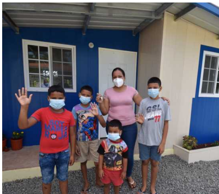
Familia numerosa, que vivía en pobreza recibe un techo confortable.

El Miviot tiene como principal objetivo dotar de viviendas seguras y confortables a familias en pobreza, pobreza extrema y en vulnerabilidad, además de personas con discapacidad y enfermedades crónicas. A la fecha se han entregado mil 10 soluciones habitacionales, incluyendo mejoras.