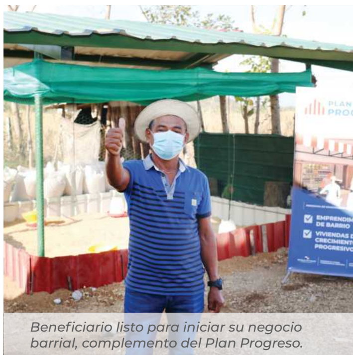
Beneficiario listo para iniciar su negocio barrial, complemento del Plan Progreso.

El Programa de Gradualidad Residencial Social, Plan Progreso, creado mediante el Decreto Ejecutivo No. 145 de 4 de agosto de 2021, consiste en la edificación de una vivienda completa, donde el propietario tendrá la opción de ampliarla, para colocar un negocio barrial, bajo la orientación y capacitación de la Ampyme e Inadeh.