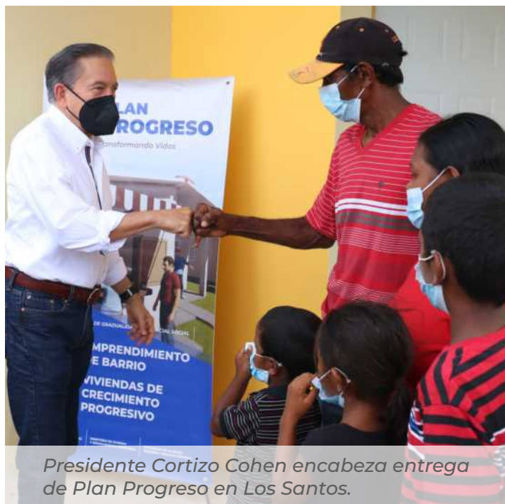
Presidente Cortizo Cohen encabeza entrega de Plan Progreso en Los Santos.

En cuanto al plan de rehabilitación de albergues, ocupados por familias afectadas por contingencias, se culminan trabajos en Los 3 Reyes Magos, ubicado en Calidonia y Divino Niño, en El Chorrillo, entre ambos beneficiando a 61 familias.