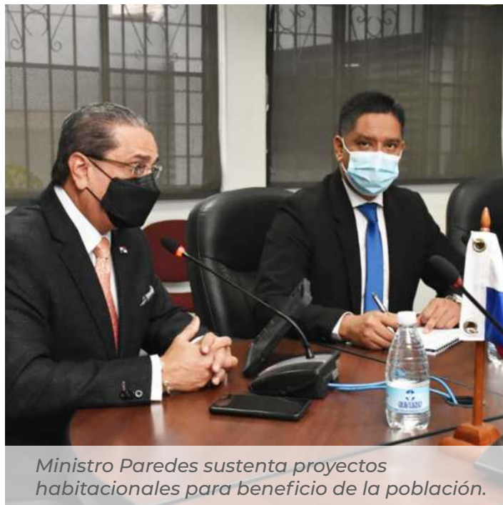
Ministro Paredes sustenta proyectos habitacionales para beneficio de la población.

Se logró una mayor eficiencia en la póliza de los vehículos asegurados, con un ahorro de 94 mil 86 balboas, manteniendo así el 100% de la flota vehicular asegurada, obteniendo el 80% de operatividad.