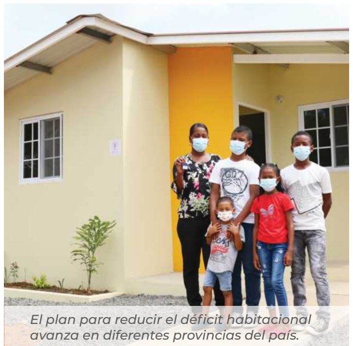
El plan para reducir el déficit habitacional avanza en diferentes provincias del país.

El Presupuesto Asignado Modificado de Funcionamiento de Miviot es de 15 millones 399 mil 536 balboas, de los cuales se ejecutó 10 millones 964 mil 63 balboas, lo que representa una ejecución de 71%; mientras que se ejecutó el 86% del presupuesto de inversión de 198 millones 301 mil 33 balboas.