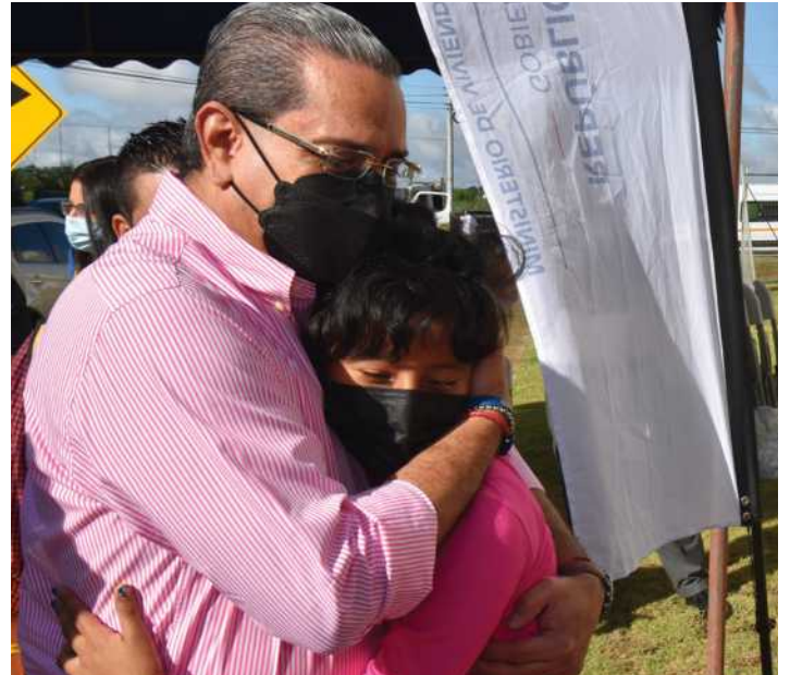
Paredes entrega vivienda a embajadora estrella de la Teletón en Ciudad Esperanza.

Un total de 201 familias con integrantes con discapacidad fueron beneficiadas con soluciones habitacionales en el país.