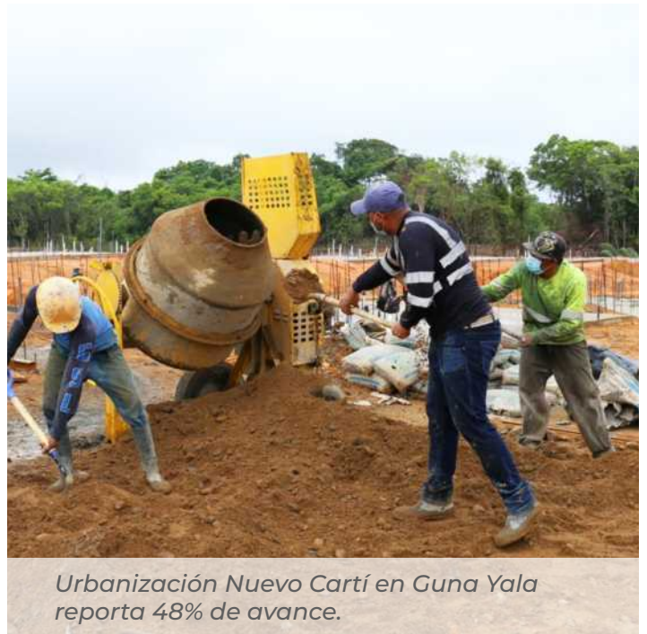
Urbanización Nuevo Cartí en Guna Yala reporta 48% de avance.

Actualmente se encuentra en evaluación de propuestas del proyecto Río Abajo-Villa Lorena Sector 1.