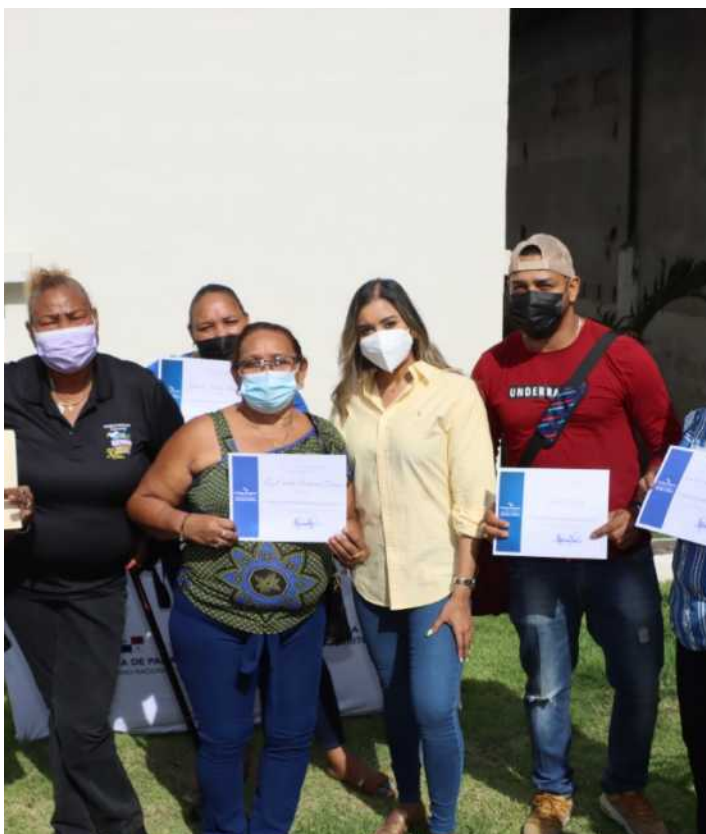
Un total de 48 familias de Brooklincito retornaron al área para ocupar nuevos apartamentos.

Se revisan y actualizan los usos de suelo y se efectúa el levantamiento digital e investigación de los folios reales ubicados en las zonas del polígono de influencia de la Línea 3 del Metro. Se adelantan las labores de actualización de los usos de suelo y escenarios tendenciales en el polígono de la Línea 2 A del Metro de Panamá.