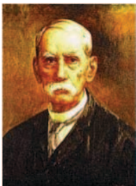
Dr. Justo Arosemena

sancionada por el coronel Tomás Herrera, a modelo y semejanza de las de Cúcuta de 1821 y de 1830. Consta el expresado estatuto de 164 artículos, divididos en once capítulos, titulados: de la ciudadanía, del gobierno del estado, de las elecciones, del poder legislativo, ejecutivo y judicial, el gobierno seccional, la fuerza armada, la interpretación constitucional, cláusulas sobre reformas constitucional y disposiciones varias. Incorpora los derechos individuales preconizados en la declaración francesa, pero niega el derecho a sufragio a ciertas clases sociales; estableciendo el derecho a ser elegido en términos de fortuna”.