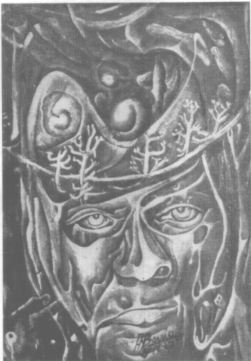
“INSTROPECCION DE UN ROSTRO” —1968— temple y óleo sobre madera, se expone en N.Y.