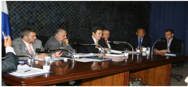
Vista de la Comisión de Presupuesto reunida en el Salón Azul

d. Presupuesto. Le corresponde las vistas previas y el debate al proyecto de Presupuesto General del Estado; la aprobación o rechazo de la Ley General de Sueldos y créditos suplementarios o extraordinarios, y del Presupuesto de la Autoridad del Canal de Panamá (artículo 53).