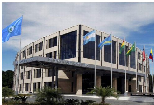
Edificio del Parlatino construido el 18 de octubre del 2013.

Propósito: Propugnar el fortalecimiento de los parlamentos de América Latina para garantizar la vida constitucional y democrática de los Estados, mantener estrechas relaciones con los parlamentos subregionales de América Latina, así como con los organismos internacionales, difundir la actividad legislativa de sus miembros, fomentar el desarrollo económico y social de la comunidad latinoamericana y coadyuvar para que se alcance la plena integración económica, política y cultural de sus pueblos; defender la plena vigencia de la libertad, la justicia social, la independencia económica y el ejercicio