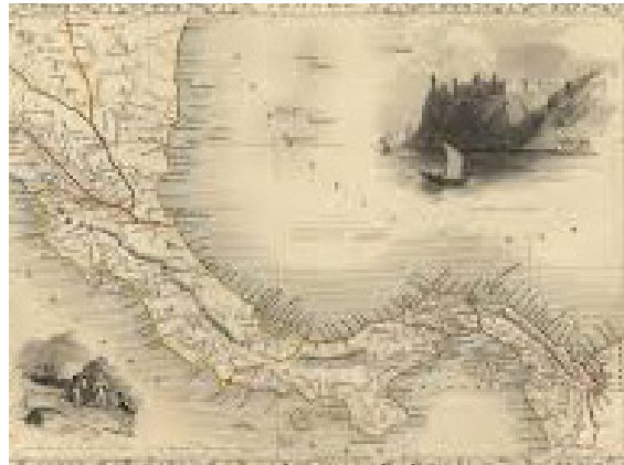
Mapa antiguo del Istmo